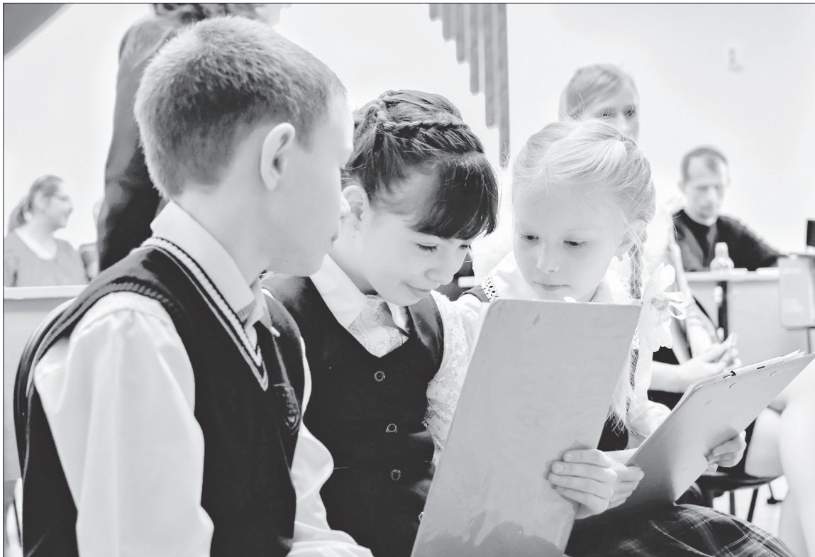
Районный социально значимый проект «Формирование комфортной среды Ханты-Мансийского района» стартовал весной 2017 года. В его подготовке активное участие приняла общественность муниципалитета, в том числе учащиеся школ района